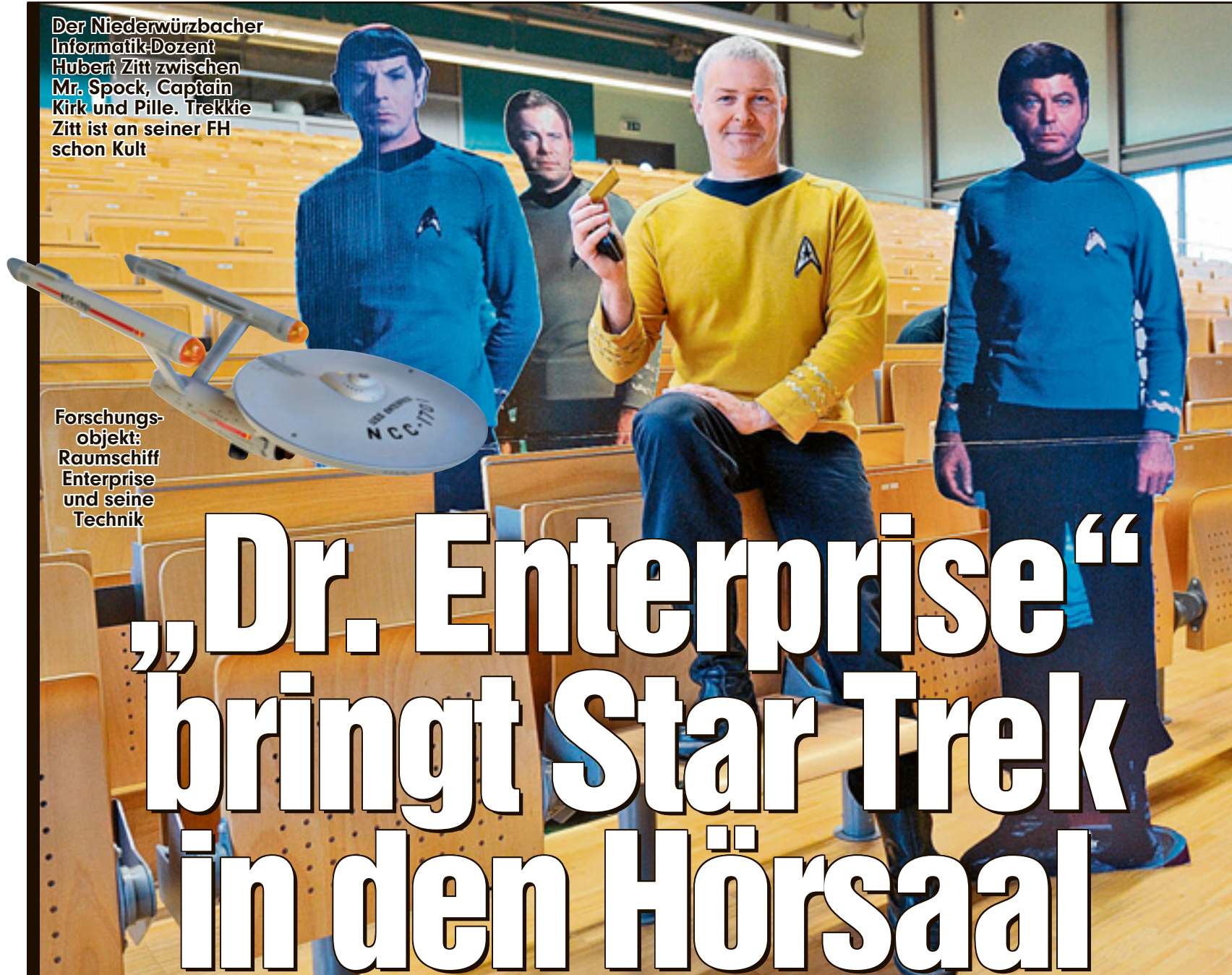
Forschungsobjekt: Raumschiff Enterprise und seine Technik