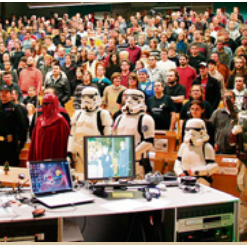
So sah es bei einer der letzten Star Trek-Vorlesungen aus. Voller Hörsaal und verkleidete Mitglieder eines Science Fiction-Fanclubs als Gäste

Niederwüzbach – Jetzt fliegt Captain Kirk in den Hörsaal.